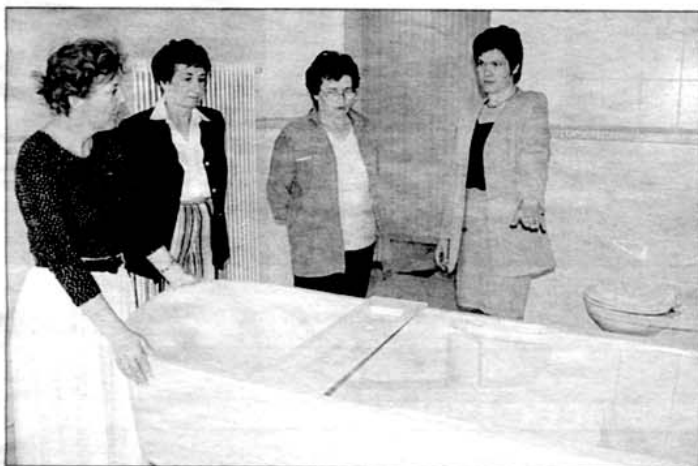
Die sanitären Anlagen sind auf die Pflegebedürftigkeit der Patienten ausgerichtet

nehmen. Auf zwei Etagen verteilt sind 18 stationäre Plätze entstanden, im wesentlichen in Einbettzimmern in gehobener Ausstattung. Im Kellergeschoß erhielt das Personal Aufenthalts- und Diensträume.